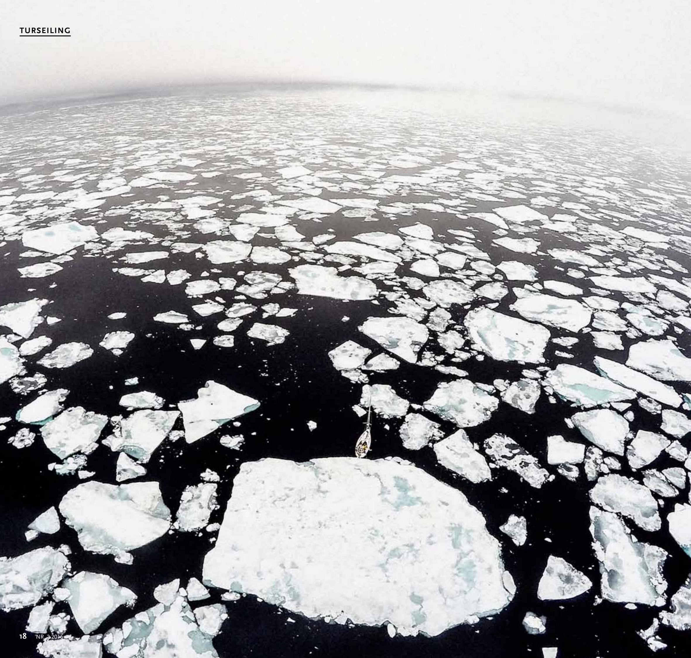
LABYRINT: I en islabyrinth på 81 grader nord.

etter isblokker som kan sette en stopper for eventyret. Radaren gir et overblikk over isforholdene, og med foroverseende sonar kan vi holde relativt høy hastighet, vel vitende om dybden 50–70 meter foran båten.