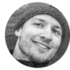
TEKST Andreas B. Heide